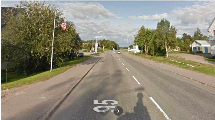
Figur 2. Gaturummet för Silvervägens centrala del, Arjeplog tätort

Inga längsgående fasader och mycket släpp med grönytor emellan husen. Vägsträckan har från 1380 till 3750 i ÅDT och antas därför vara platsen för högst exponering 13 .