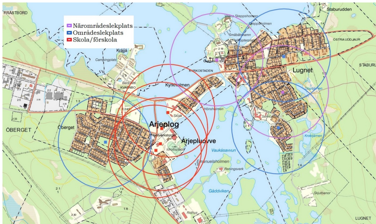
Bild 7.2 Upptagningsområde om 500 meter efter slutliga åtgärder