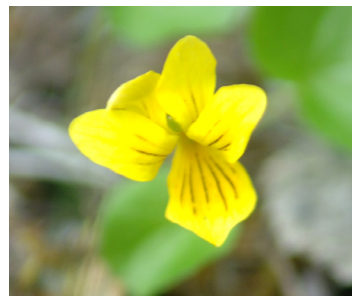
Fjällviol ( Viola biflora )