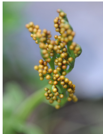
Nordlåsbräken ( Botrychium boreale )