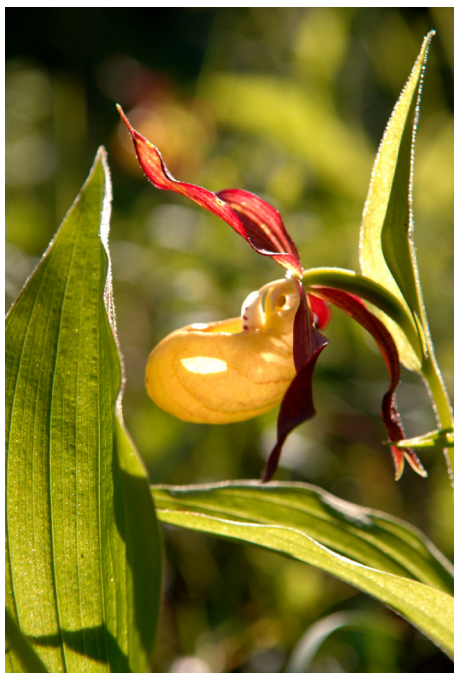
Guckusko ( Cypripedium calceolus )

I Märkforsen finns flera utrotningshotade och sällsynta växter.