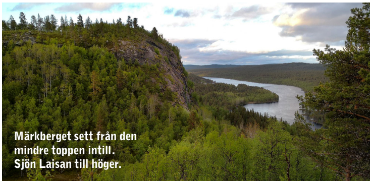
Märkberget sett från den mindre toppen intill. Sjön Laisan till höger.

Skydd: Finns ej på toppen, men i Sikselet finns en ny bakval med grillplats.