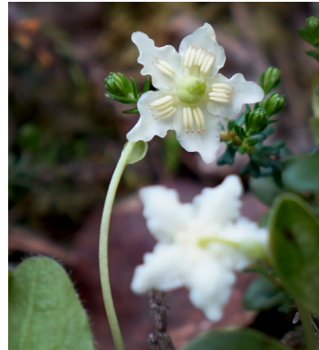
Ögonpyrola ( Moneses uniflora )