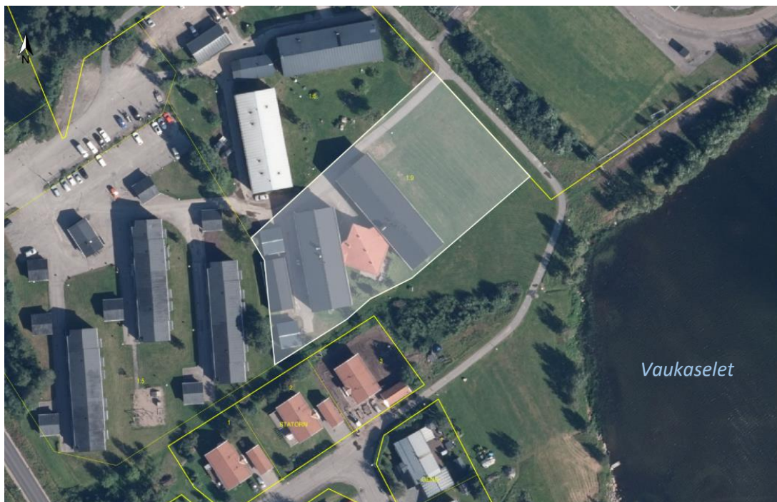
Planområdet i förhållande till vattenområdet.

Innebär förslaget till detaljplan innebär att planområdet får tas i anspråk för att anlägga vissa åtgärder, så kallade MKB-projekt?