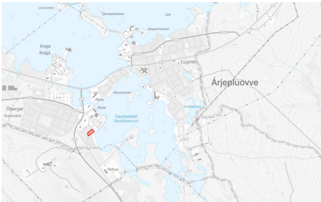
Översiktskarta med planområdet i rött.

försäljning av fastigheten. Efterfrågan på tillfälligt boende är stort och byggnaden är redan idag anpassad för detta ändamål. Med hänsyn till planområdets lokalisering i angränsning till befintligt bostadsområde bedöms det även vara lämpligt att möjliggöra för bostäder i planen.